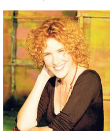
Lucrezia Lante della Rovere