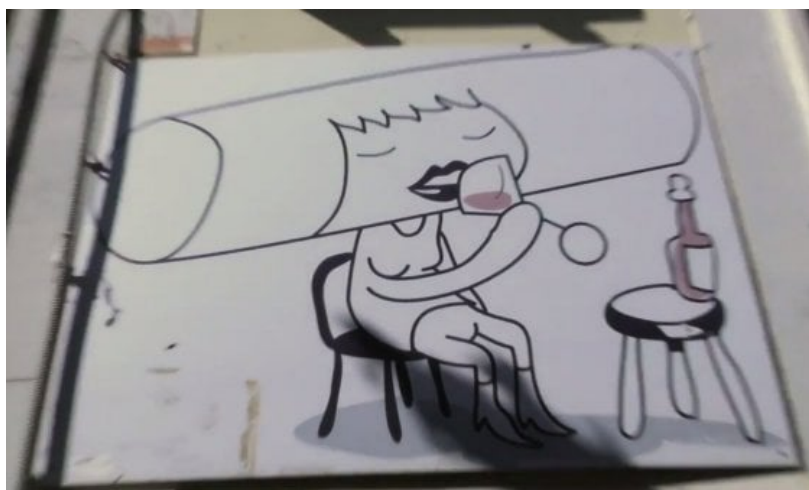
Libreria Tuba, Pigneto

Promuovere la cittadinanza attiva. "I linguaggi del gioco, del cinema, del teatro, del documentario e della letteratura sono tra i più efficaci per promuovere la cittadinanza attiva e le scelte sostenibili che stanno al cuore del progetto di Banca Etica - spiega Ugo Biggeri, presidente di Banca Etica ed Etica sgr - Le produzioni culturali, poi, si prestano benissimo ai finanziamenti dal basso tipici del crowdfunding. Ci è sembrato naturale proporre un bando su questi temi, e i fatti ci hanno dato ragione: la quantità e qualità dei progetti arrivati alla valutazione della commissione è stata molto elevata e la selezione dei 15 da ammettere al bando non è stata affatto semplice. Ora sarà il pubblico a decidere quali dei 15 progetti selezionati vedrà la luce, anche con il contributo del Gruppo Banca Etica".