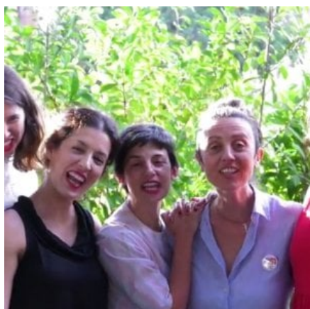
Le organizzatrici del festival InQuiete

ROMA. Un festival nato per dare visibilità alle donne e alla loro scrittura, declinato dal fil rouge della voce letteraria femminile, spesso all'interno di eventi di questo tipo relegata a una posizione di secondo piano. Questo il senso profondo di InQuiete, rassegna unica nel suo genere in Italia che approderà nello storico quartiere romano del Pigneto, con eventi distribuiti tra la Biblioteca del Comune di Roma Goffredo Mameli e la libreria delle donne Tuba, dal 22 al 24 settembre.